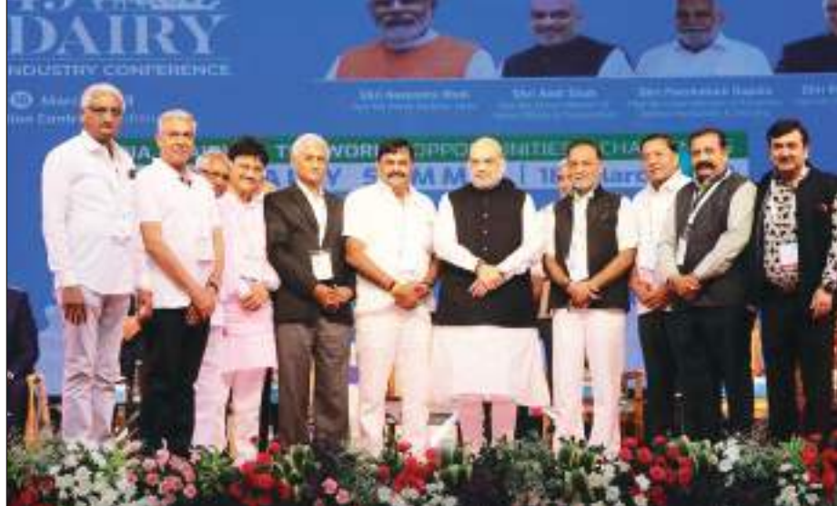
केंद्रीय सहकारिता मंत्री अमित शाह ने गुजरात में एक कार्यक्रम में शिरकत की।

करते हैं। वर्ष 2017 से अभी तक अपने पहले और दूसरे कार्यकाल में योगी आदित्यनाथ 100 बार बाबा के दरबार में हाजिरी लगाने वाले पहले मुख्यमंत्री बने गये हैं। वहीं मुख्यमंत्री योगी आदित्यनाथ शुक्रवार को 113वाँ बार वाराणसी के दो दिवसीय दौरे पर आये। दौरे के दूसरे दिन मुख्यमंत्री ने श्रीकाशी विश्वनाथ धाम में दर्शन पूजन कर नया कीर्तिमान बनाया है। योगी आदित्यनाथ महीने में एक बार या कभी-कभी दो बार काशी की यात्रा जरूर करते हैं।