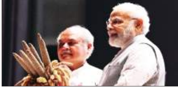
दिल्ली के पूसा स्थित भारतीय कृषि अनुसंधान संस्थान (आईएआरआई)

टीएम एक्शन इंडिया/नई दिल्ली प्रधानमंत्री नरेंद्र मोदी ने शनिवार को केंद्र सरकार के श्री अन्न (मोटा अनाज) अभियान को भारत में समग्र विकास का माध्यम बताते हुए कहा कि इससे 2.5 करोड़ छोटे और सीमांत किसानों को लाभ होगा। उन्होंने कहा कि भारत एक वैश्विक आंदोलन के रूप में मोटे अनाज या 'श्री अन्न' को बढ़ावा देने के लिए लगातार काम कर रहा है। प्रधानमंत्री मोदी ने नई