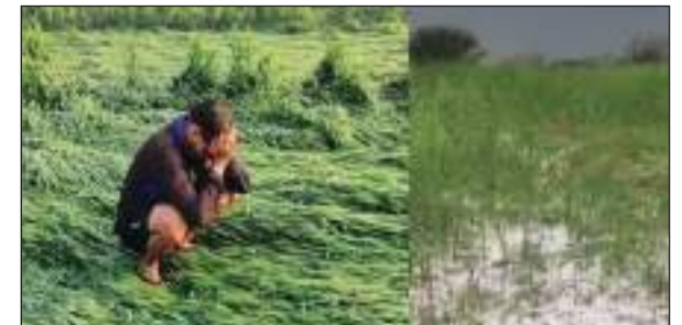
प्रभावितों को तत्काल वित्तीय सहायता दी जाए। फसलों को हुए नुकसान का आकलन कर शासन को आख्या उपलब्ध कराई जाए। ताकि इस संबंध में आगे की कार्रवाई की जा सके और किसानों को राहत दिलाई जा सके।

टीएम एक्शन इंडिया/लखनऊ उत्तर प्रदेश में हुई बारिश और ओलावृष्टि को लेकर मुख्यमंत्री योगी आदित्यनाथ ने शनिवार को जिलों के सभी अधिकारियों को निर्देश दिए हैं कि पूरी तत्परता से राहत कार्य संचालित करें। आपदा से हुई जनहानि में प्रत्येक प्रभावित परिवार को चार लाख रुपये की अनुमति राहत राशि तत्काल उपलब्ध कराई जाए। उन्होंने कहा कि जिन लोगों के घरों को नुकसान पहुंचा अथवा पशुहानि हुई, ऐसे